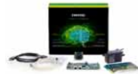
phyBOARD-Pollux AI Kit