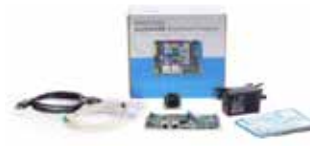
phyBOARD-Pollux Development Kit