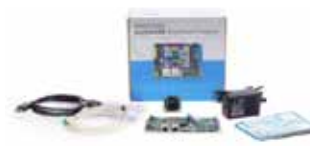
phyBOARD-Pollux Imaging Kit